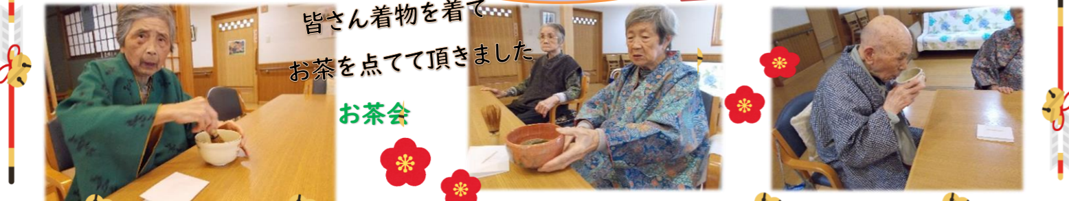
皆さん着物を着てお茶を点てて頂きました