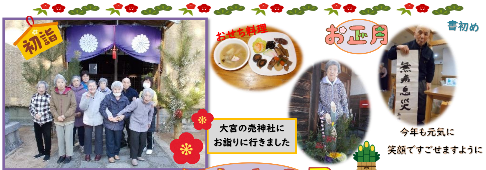
大宮の売神社にお詣りに行きました