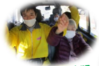
丹後の貴重な晴間 出発~