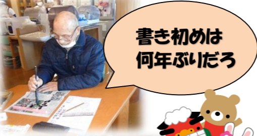
書き初めは何年ぶりだろ